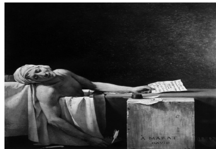
[그림 2] 활동지 구성③-역사쓰기 예

“이게 예술을 가장한 속임수가 아닐까...예술의 정치적인 면을 잘 보여줍니다.”